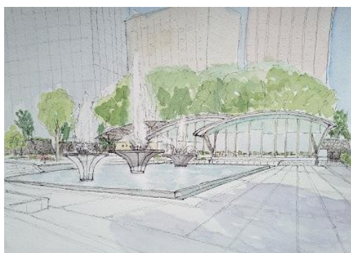
和田倉門噴水 NHK 7/25