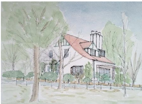
聖路加病院トイスラー教会 ION 2021 2/10