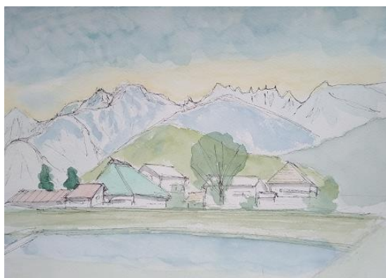
新田入口から遠見 JVC 6/1