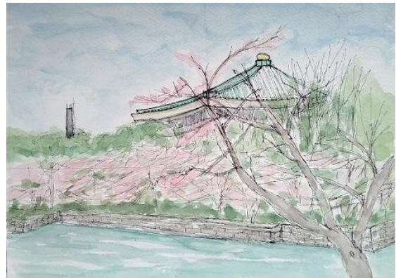
九段下から武道館 ION 2021 3/24