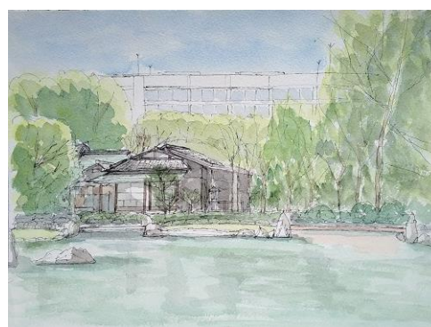
靖国神社 庭園 NHK 8/27