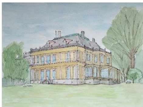
岩崎邸 ION 10/14