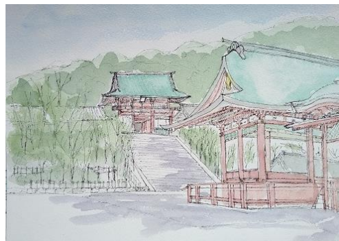
鶴岡八幡宮 ION 10/28