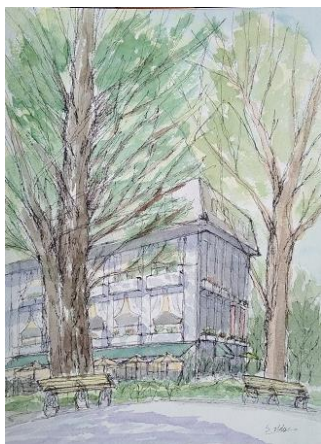
日比谷公園 松本楼 ION 9/9