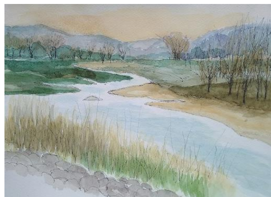
冬の浅川から山並み