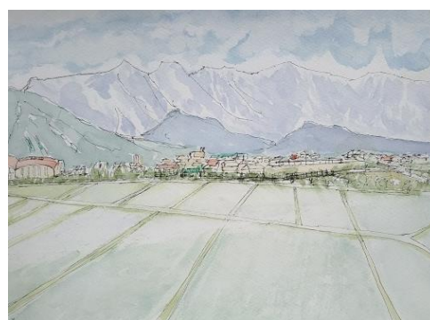
天神坂より JVC 6/1