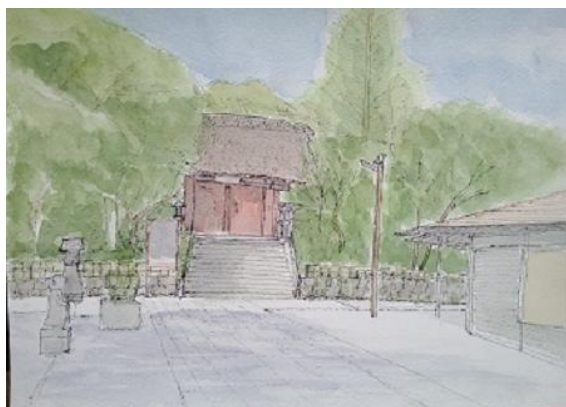
深大寺正門 自トレ 5/1