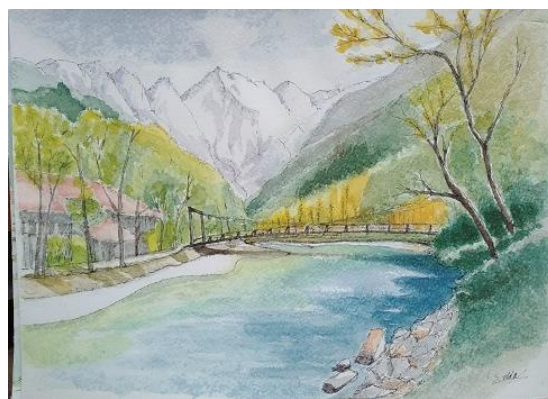
上高地 JVC 自トレ 7/6 出展作品