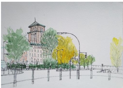
日本大通り県庁 ION 11/20