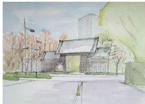
乾門 ION 11/11