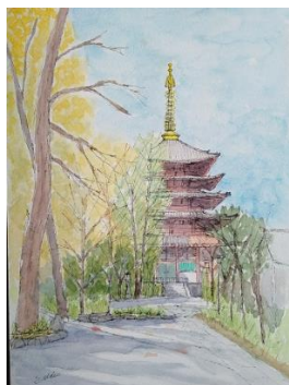
高幡不動尊 ION11/6 NHK 出展作品