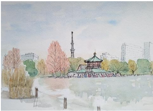
上野不忍池 ION 12/9