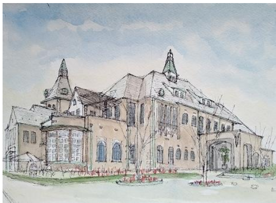
永田町 竜王邸 ION 2021 3/19