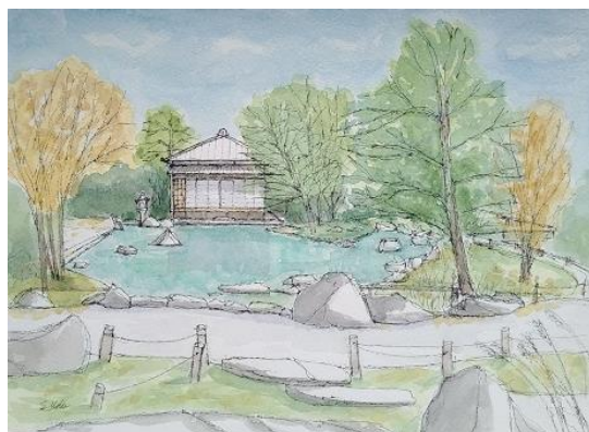
二子玉、帰真園 ION 10/2 出展作品