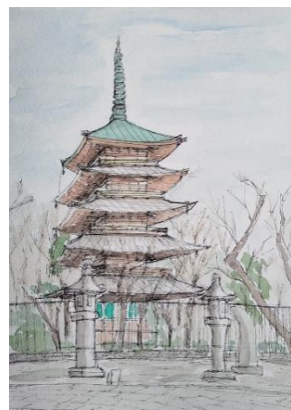
上野 寛永寺五重塔 NHK2021 2/18