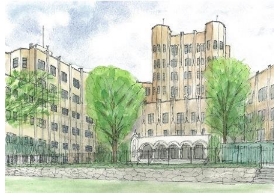
白金台 東大医科学研究所 ION 10/23