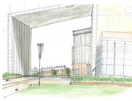
ナビスコより赤レンガ ION 5/22