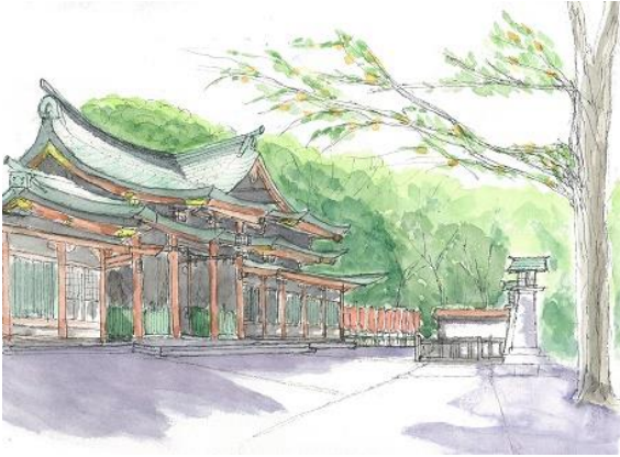
日枝神社境内 ION 10/9