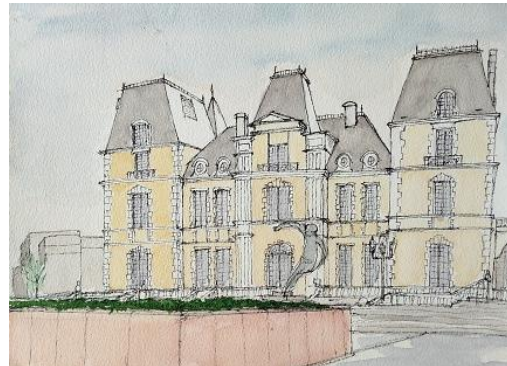
2020.1.31 エビスガーデンプレス IONC