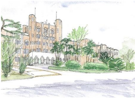
「ゆかしの杜」 東大医科学研究所 ION10/24