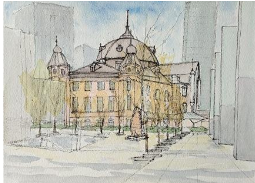
2019.12.25 東京駅 IONA