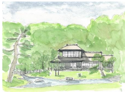
三溪園 臨春閣 5/23