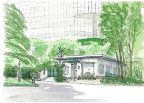
日比谷公園 消えるレストラン IONC7/20 (売却)