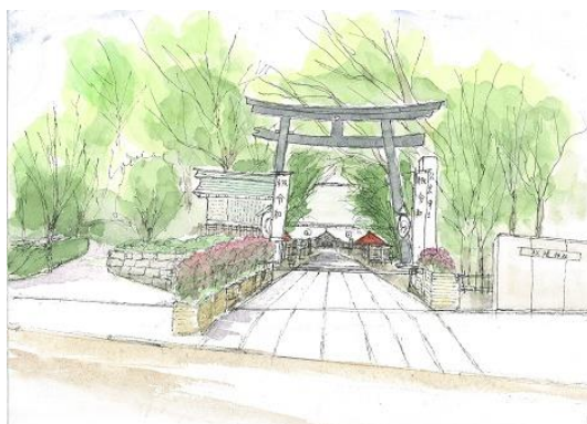
松陰神社前 ION 5/3