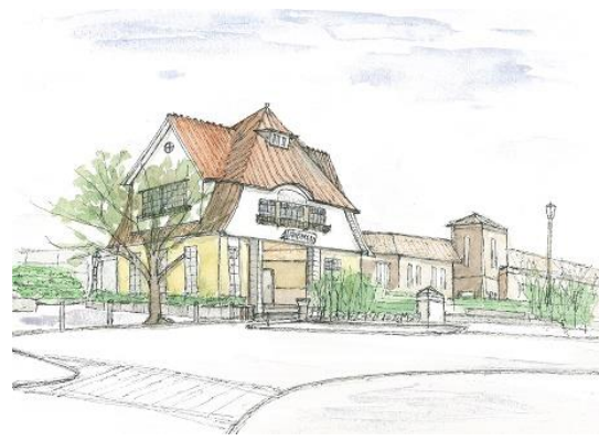
田園調布駅 ION 11/13