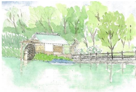
渋谷 松濤公園 ION 7/5