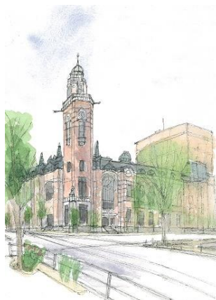
開港記念館 ION 4/24