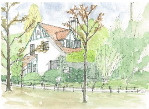
聖路加病院トイスラー教会 ION 11/22