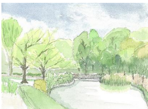
北丸の内公園 NHK 4/25