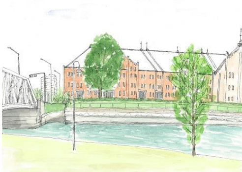
開港 波内場から赤レンガ ION 7/24