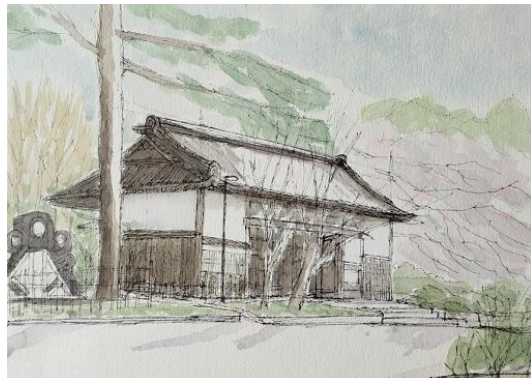
2020.3.25 上野 黒門 NHK