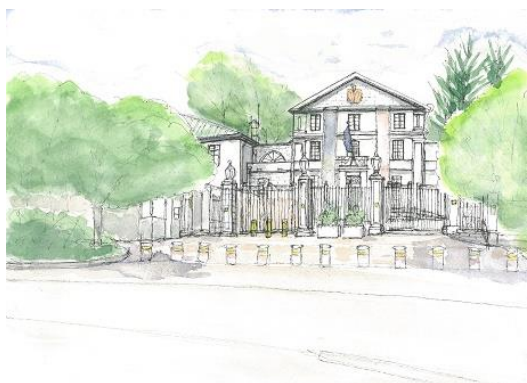
イギリス大使館 ION 5/8