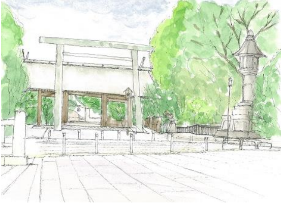
靖国神社 ION 9/11