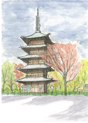
上野 寛永寺五重塔 ION 12/6 ここからスマホのカメラ画像