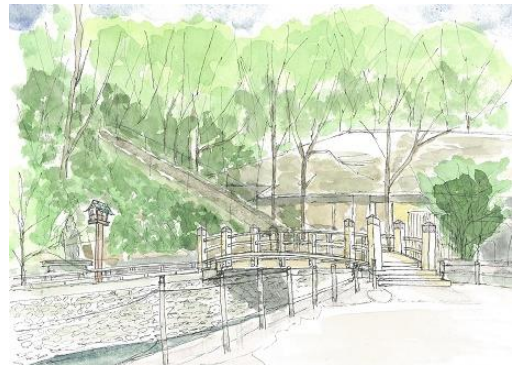
等々力溪谷 NHK 7/25