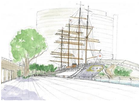
横浜、日本丸 ION 6/26