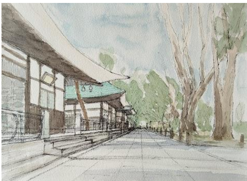
2020.2.20 九品仏境内