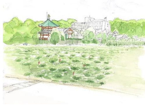
上野 不忍池 弁天堂 NHK 6/27