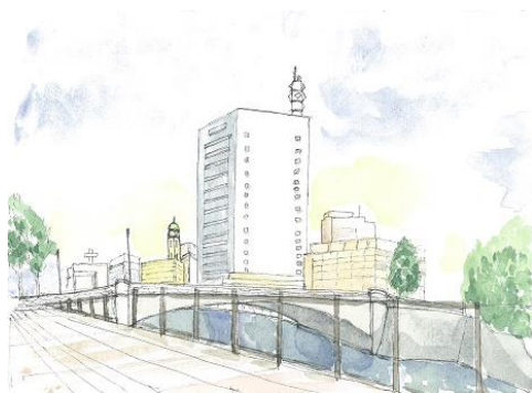
万国橋より ION 5/22