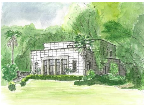
青淵文庫 旧渋谷資料館 NHK 8/22