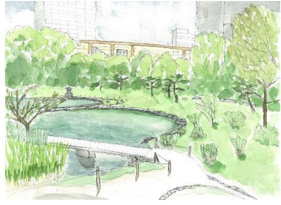
旧芝離宮恩賜庭園 NHK 9/26