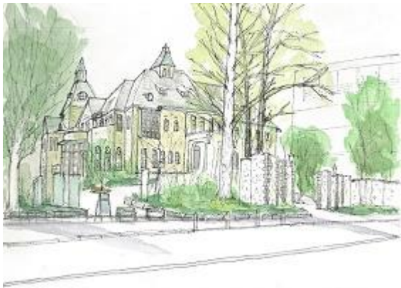
赤坂 旧李王邸を描く ION10/10 手前の樹をしっかり描くこと