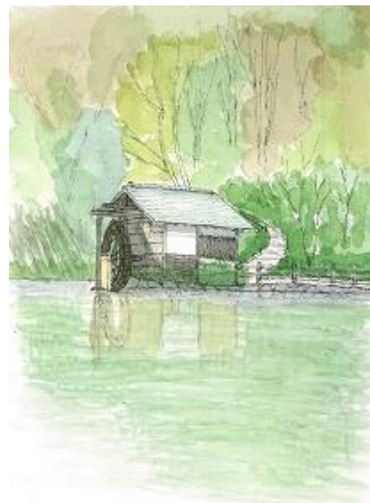
渋谷 松濤公園 ION10/24