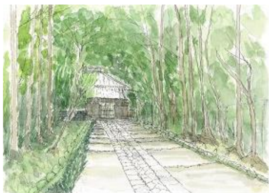
寿福寺境内 ION 5/23 台形を思い出すこと。肥後細川庭園 NHK5/24 手前の道をしっかり描くこと