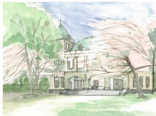
旧前田庭園 NHK 2/28