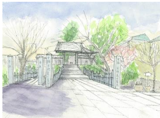
泉岳寺 ION 3/1