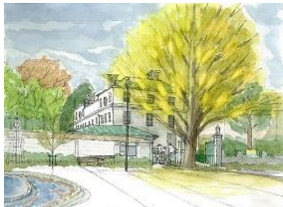
横浜で開港広場で描く NHK 11/22 床石の方向に注意