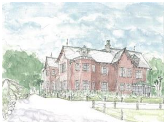
旧古河庭園にて 4.20 IONc