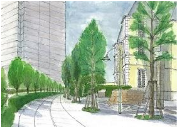
恵比寿ガーデンプレス NHK8/23 樹に変化を持たせること。