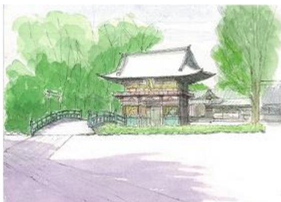
根津神社を描く NHK 6/28