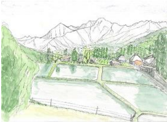
信濃森上 青鬼村落から後立山 5/16