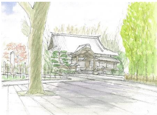
泉岳寺 ION 2/27