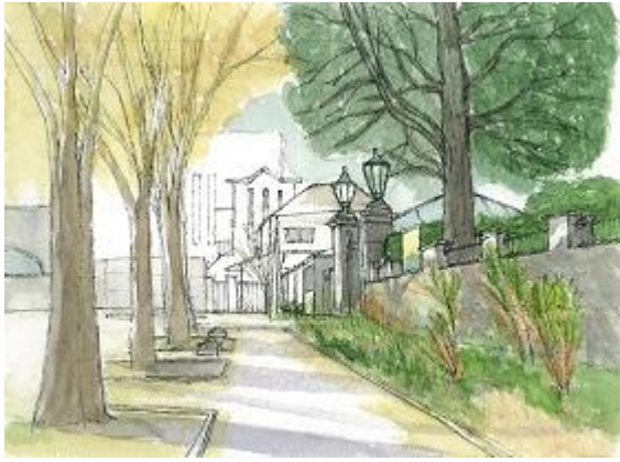
横浜で開港広場で描く ION 11/28 消失点を意識すること。