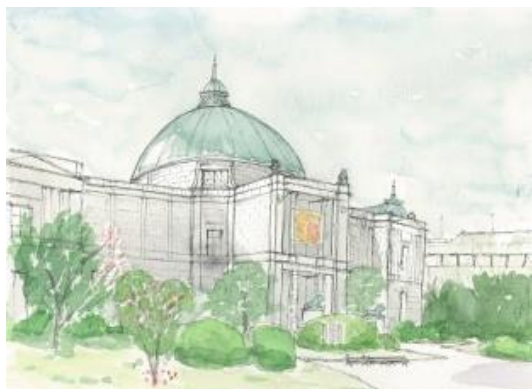
上野、表慶館を描く 4.06 IONc