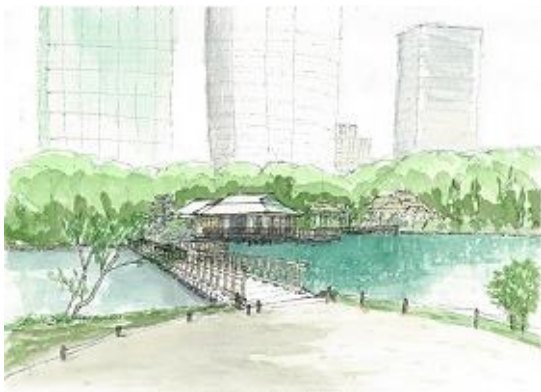
浜離宮庭園 NHK 7/26 背景のビルしっかり描く