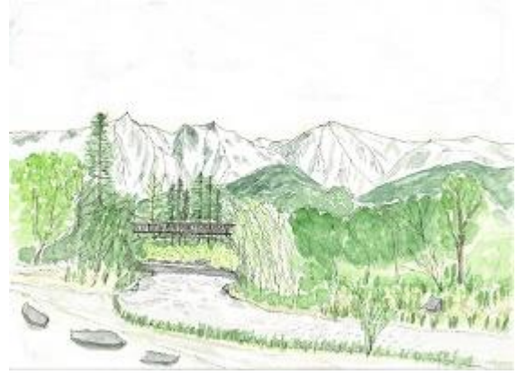
白馬、大出より後立山 自主トレ 5/16