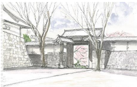
九段下 田安門 ION 3/27