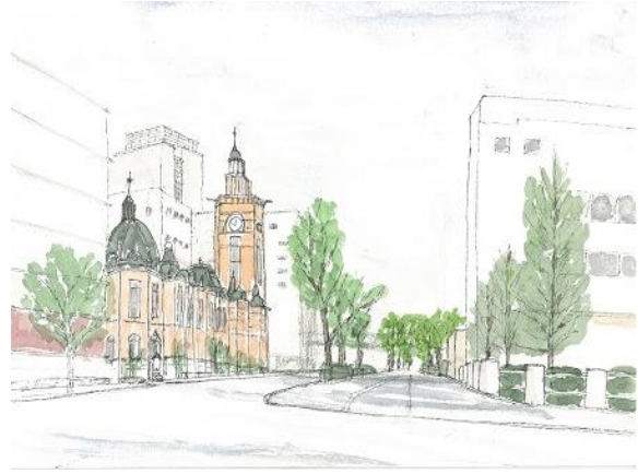
横浜 開港記念館 ION 12/26