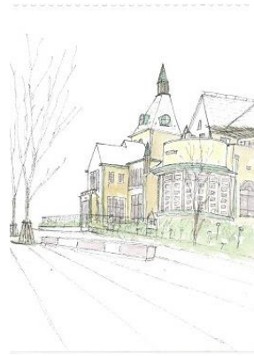
赤坂 旧李王邸を描く NHK 2/21