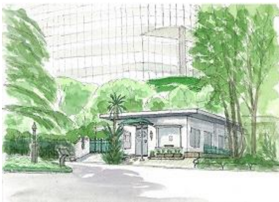
日比谷公園 消えるレストラン IONC7/20