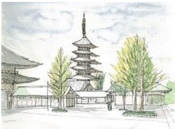
浅草寺の五重塔を描く ION 11/13