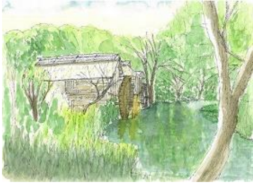
豊科 わさび王 自主トレ 5/15