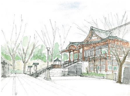
目黒不動尊 ION 2019年1/23 スキャナー変更しました。