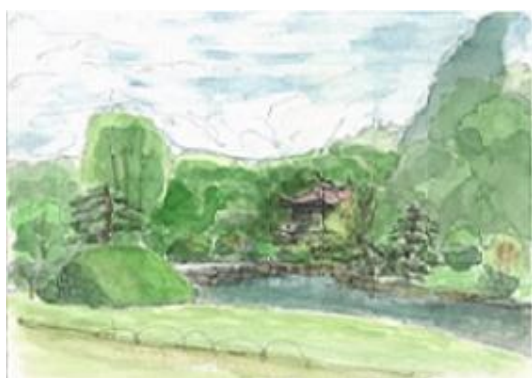
新宿御苑 台湾閣付近 NHK 4/26